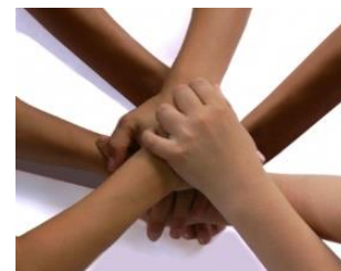
Grafik: © Förderverein/ Leni Kirchert

Förderverein der Grundschule auf dem lichten Berg e.V., foerderverein@gs-lichtenberg-berlin.de