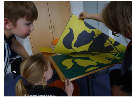
Foto: Schulhof © Kirchert; Projektarbeit © Karolin Hägele/ Graphik-Collegium Berlin e.V.